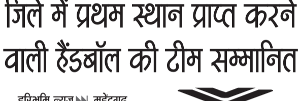
महेन्द्रगढ़। विजेता टीम को सम्मानित करते हुए।