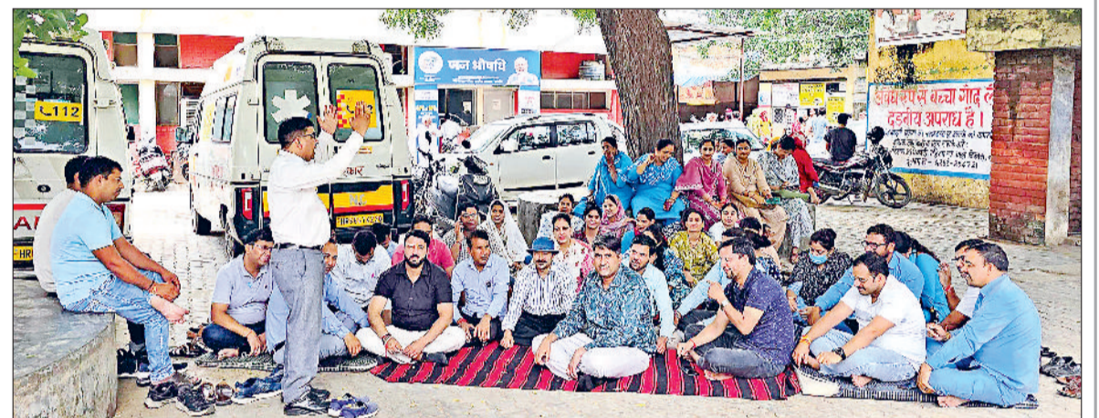
नारनौल। नागरिक अस्पताल में दो घंटे का धरना देते एनएचएम कर्मचारी।