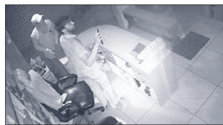
सतनाली मंडी। दुकान में लगे सीसीटीवी में दिख रहे चोर।