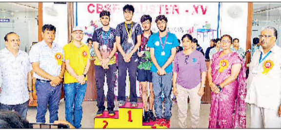
नारनौल। प्रतियोगिता के विजेता विद्यार्थी।

एमआर पब्लिक स्कूल अटेली में सीबीएसई की ओर से आयोजित करवाए जा रहे 15वें टेबल टेनिस के मुकाबलों के तीसरे दिन में आयुवर्ग 14, 17, 19 के फाइनल खेल हुए। जिनके परिणाम बहुत ही रोचक रहे। खिलाड़ियों ने मैच पर कब्जा करने के अपना पूरा प्रयास किया। प्रतियोगिता के समापन के दिन मुख्य अतिथि एसडीएम रमित यादव ने शिरकत की। आयुवर्ग 14 के एकल मुकाबले में डीपीएस हिसार ने स्वर्ण पदक प्राप्त किया। डीपीएस फरीदाबाद को रजत पदक तथा मानव रचना फरीदाबाद व डीपीएस फरीदाबाद को संयुक्त रूप से कांस्य पदक मिला। इसी प्रकार आयुवर्ग 17 के परिणामों में बाल भारती मानेसर ने स्वर्ण पदक, प्रिजिडियम स्कूल