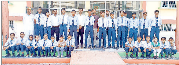
नारनौल। विद्या देवी स्कूल के विद्यार्थी।

कक्षा चौथी के बच्चों ने झूला मेकिंग प्रतियोगिता में भगवान कृष्ण के लिए सुंदर झूले बनाए। कक्षा पांचवीं के बच्चों ने ग्लास पेंटिंग प्रतियोगिता में अपनी पेंटिंग कौशल का प्रदर्शन किया और भगवान कृष्ण की सुंदर तस्वीरें बनाईं। कक्षा दूसरी के बच्चों ने बांसुरी मेकिंग प्रतियोगिता में भगवान कृष्ण की बांसुरी बनाने में अपनी रचनात्मकता