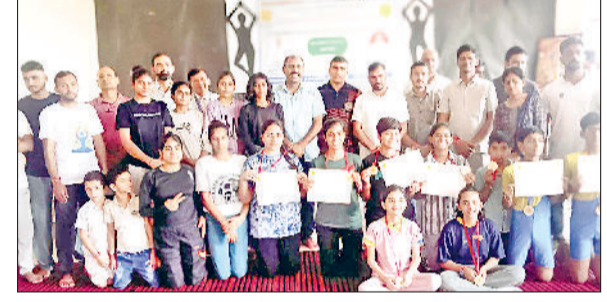
महेंद्रगढ़। विद्यार्थियों को सम्मानित करते हुए।

रजत पदक व हैरिटेज स्कूल गुरुग्राम व डीपीवी फरीदाबाद को संयुक्त रूप से कांस्य पदक मिला। आयुवर्ग 17 में बाल भारती स्कूल को स्वर्ण, एसबी मॉडल स्कूल को रजत पदक व अमेटी स्कूल गुरुग्राम तथा मानव रचना स्कूल सेक्टर 14 फरीदाबाद को संयुक्त रूप से कांस्य पदक मिला। आयुवर्ग 19 में मानव रचना स्कूल सेक्टर 14 फरीदाबाद की टीम को स्वर्ण पदक मिला, वहीं एमवीएन