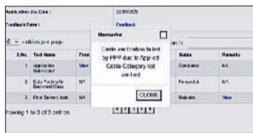
नारनौल। पोर्टल में दिखाया गया एरर।

नागरिकों का कहना है कि जब वे जाति प्रमाण पत्र के लिए आवेदन करते हैं तो उनके अनुरोध