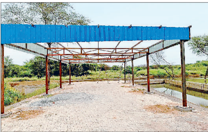
महेन्द्रगढ़। गांव देवनगर के बांध पर लगाया गया टीनशेड।

आसपास के ग्रामीण अक्सर गर्मी के मौसम बांध का आनंद लेते हैं तथा युवा यहां तैराकी करते हैं। बांध के प्रति लोगों की रुचि को देखते हुए ग्राम पंचायत की ओर से बांध को मिनी झील के रूप में विकसित करने की योजना तैयार की है। इसी तहत ग्राम पंचायत की ओर से बांध के साथ 27 बाई 50 का टीनशेड लगावा दिया गया है। अब टीनशेड के अंदर कुर्सियां लगावाई जाएंगी। इसके अलावा डिवाइड वाली