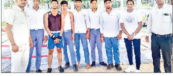
महेन्द्रगढ़। विजेता खिलाड़ियों को सम्मानित करते हुए।