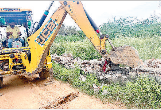
नारनौल। अवैध निर्माण हटाती जेसीबी मशीन।

जिस जिला प्रशासन की मदद से तोड़ दिया गया। इस दौरान छह चारदीवारी व 15 डीपीसी के साथ-साथ सभी कच्चे रास्ते उखाड़ दिए