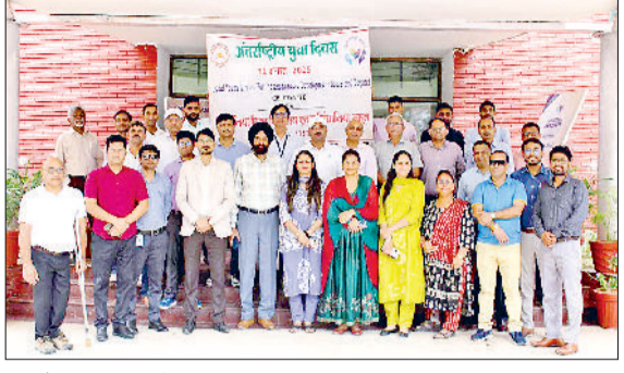
नारनौल। कार्यक्रम में उपस्थित स्टाफ सदस्य।